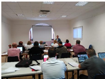
Laluenga, taller sobre compras online

Entre los proyectos no productivos que recibieron subvención el año pasado está la adquisición por parte de la Comarca del Somontano de Barbastro de un aula móvil informática.