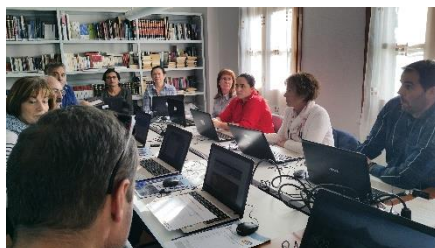
Salas Bajas, jornada sobre DNI electrónico